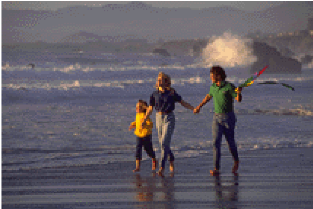
Resmi veya grafiği açıklayan alt yazı.

Yeterli alan varsa, buraya küçük bir resim veya başka bir grafik eklenebilir.